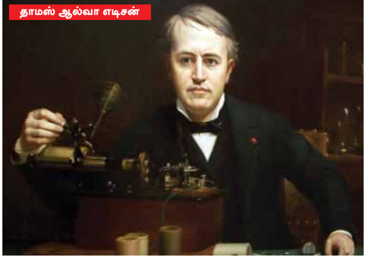
தாமஸ் ஆல்வா எடிசன்

குறிக்கோளுடன் வாழ்வது என முடிவுசெய்தால் உங்கள் வாழ்க்கையில் எவ்வளவு சோகங்கள்