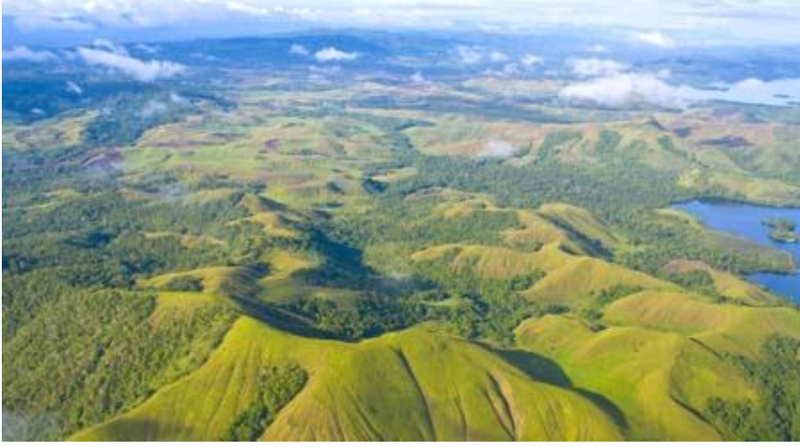
கரடு முரடான நில