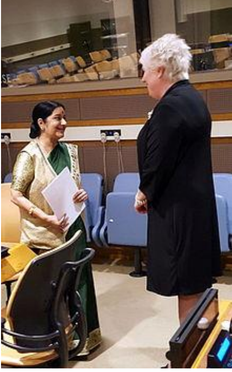
இந்திய எஸ்தோனியா வெளியுறவு அமைச்சர்கள் சந்திப்பு

2015 செப்டம்பர் மாதம், இந்திய வெளியுறவுத்துறை அமைச்சர் சுஷ்மா சுராஜ் அவர்களும் எஸ்தோனிய வெளியுறவுத்துறை அமைச்சர் மரினா கல்ஜூரண்டு அவர்களும் இருநாட்டு விவகாரங்கள் தொடர்பாக 70வது ஐநா பொதுசபையில் சந்தித்துப் பேசியுள்ளனர். ஏறத்தாழ 235 இந்தியர்களும், 500 ஈழத்தமிழர்களும் அங்கு வாழ்கின்றனர். இந்தியாவின் எஸ்தோனியத் தூதரகம் பின்லாந்தின் எல்சிங்கி நகரிலும், எஸ்தோனியாவின் இந்தியத்தூதரகம் புதுடில்லியிலும் உள்ளன.