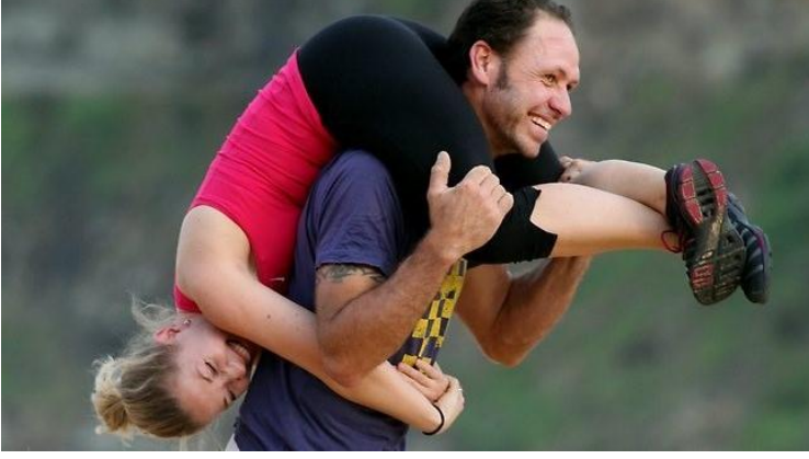
மனைவியைச் சுமந்து ஓடும் கணவர்

காணமுடியாதபடி கையிருப்பு மிச்சமே உள்ளதாம். ஜனவரி 2011 முதல் இந்நாடும் யூரோ நாணயத்தை ஏற்றது. யூரோ பயன்படுத்தும் நாடுகளில் மிகக்குறைந்த கடன் உள்ள நாடும் இதுவே.