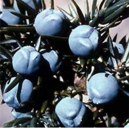
ஜூனிபர் பெர்ரி பழங்கள்

இங்கு விளையும் ஜூனிபர் பெர்ரி(Juniper Berry) என்ற பழம் 99 வகை நோய்களை குணப்படுத்துவதோடு, இப்பழத்தின்மேல் சிலுவை அடையாளம் உள்ளதால் அது பேய்களை, சூன்யத்தை விரட்டுவதாகவும் நம்பப்படுகிறது.