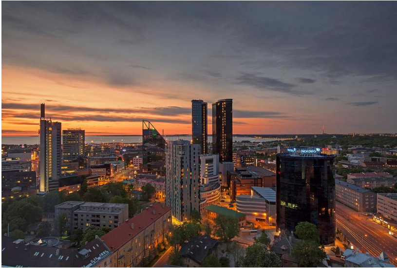
டலின் வணிக மையம்

இதன் தலைநகரமும், நாட்டின் பெரிய நகரமும் டலின்(Tallinn) ஆகும். ஆனால் ஆண்டு முழுவதும் சூழலுக்கேற்ப தலைநகர் மாறும். டார்டு(Tartu) கலாச்சார தலைநகராகும். பார்னு(Parnu) கோடைத்தலைநகராகும். 4,04,500 மக்கள் வாழும் தலைநகர் டலின் பழையனவும் புதியனவும் கலந்துகாணப்படும் அருமையான சுற்றுலா நகரமாகும். ஐரோப்பாவின் பல நகரங்களில் மத்திய கால கட்டடங்கள் மறைந்து விட்ட நிலையில் இங்கு இத்தகைய கட்டடங்களும், ஆலயங்களும் உயிர்ப்புடன் பாதுகாக்கப்பட்டு, உலக மரபுச்சின்னங்களாக அறிவிக்கப்பட்டுள்ளன. 21 கோபுரங்கள் நகர மதிலையொட்டி இன்னும் காணப்படுகின்றன.