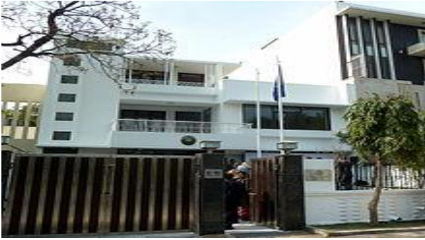
புது டில்லி எஸ்தோனியா இந்திய தூதரகம்

2015 செப்டம்பர் மாதம், இந்திய வெளியுறவுத்துறை அமைச்சர் சுஷ்மா சுராஜ் அவர்களும் எஸ்தோனிய வெளியுறவுத்துறை அமைச்சர் மரினா கல்ஜூரண்டு அவர்களும் இருநாட்டு விவகாரங்கள் தொடர்பாக 70வது ஐநா பொதுசபையில் சந்தித்துப் பேசியுள்ளனர். ஏறத்தாழ 235 இந்தியர்களும், 500 ஈழத்தமிழர்களும் அங்கு வாழ்கின்றனர். இந்தியாவின் எஸ்தோனியத் தூதரகம் பின்லாந்தின் எல்சிங்கி நகரிலும், எஸ்தோனியாவின் இந்தியத்தூதரகம் புதுடில்லியிலும் உள்ளன.