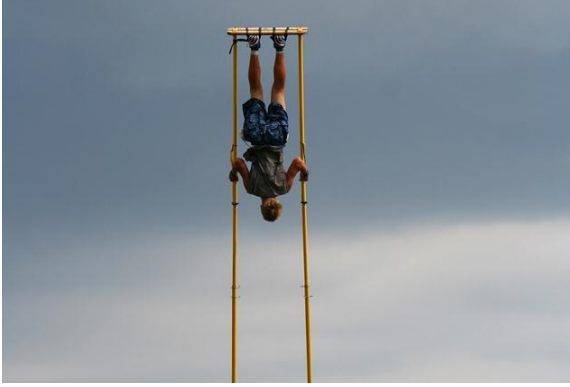
கீகிங் என்ற முழுச்சுற்று ஊஞ்சல்

எதையும் புதுமையாகச் செய்வதில் ஆர்வமுடையவர்கள் எஸ்தோனியர்கள். மனைவியரைத் தோளில் அல்லது கழுத்தில் தலைகீழாக உப்புமுட்டை விளையாடுவதுபோல சுமந்தபடி ஓடும் வேடிக்கையான ஓட்டப்பந்தயம் இங்கு உருவாகி புகழ்பெற்றுள்ளது.