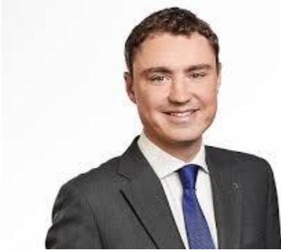
36 வயது பிரதமர் டாவி ரோய்வாஸ்

விடுதலைக்குப்பின் இந்நாடு ஜனநாயக நாடாளுமன்ற குடியரசானது. ஐரோப்பிய நாடுகளிலேயே அதிக நாள்பிரதமராக இருந்த ஆண்டுருஸ் அன்சிப் (2005-14) அவர்களின் ஆட்சி முடிந்து இன்று 36 வயது இளைஞரான டாவி ரோய்வாஸ் பிரதமராக உள்ளார்.