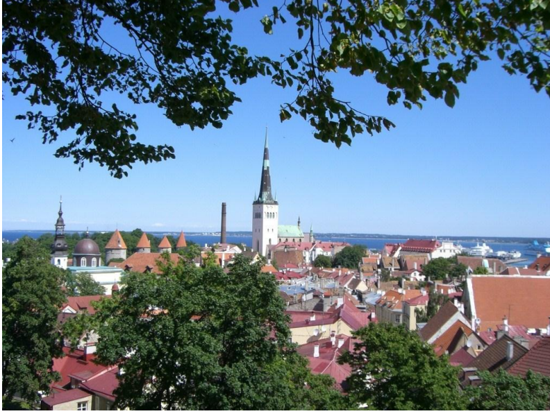
பழமை மாறா டலின் நகர்

இதன் தலைநகரமும், நாட்டின் பெரிய நகரமும் டலின்(Tallinn) ஆகும். ஆனால் ஆண்டு முழுவதும் சூழலுக்கேற்ப தலைநகர் மாறும். டார்டு(Tartu) கலாச்சார தலைநகராகும். பார்னு(Parnu) கோடைத்தலைநகராகும். 4,04,500 மக்கள் வாழும் தலைநகர் டலின் பழையனவும் புதியனவும் கலந்துகாணப்படும் அருமையான சுற்றுலா நகரமாகும். ஐரோப்பாவின் பல நகரங்களில் மத்திய கால கட்டடங்கள் மறைந்து விட்ட நிலையில் இங்கு இத்தகைய கட்டடங்களும், ஆலயங்களும் உயிர்ப்புடன் பாதுகாக்கப்பட்டு, உலக மரபுச்சின்னங்களாக அறிவிக்கப்பட்டுள்ளன. 21 கோபுரங்கள் நகர மதிலையொட்டி இன்னும் காணப்படுகின்றன.