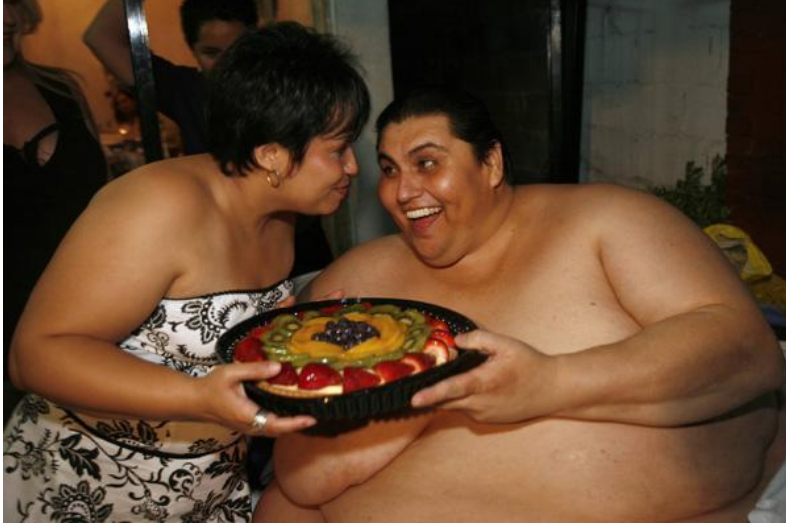
குண்டான நவ்ரு தம்பதியர்

மக்கள் செல்வச்செழிப்பில் வாழ்ந்ததன் விளைவாகவோ என்னவோ நவ்ருக்கள் மிகவும் உடல் பருமன் மிகுந்தவர்கள் ஆயினர். உலகிலேயே உடல் நிறைகுறியீட்டு எண் ( BMI- Body mass index) அதிகமாக உள்ள மக்கள் நவ்ருக்களே. உலக சராசரி 18.5 - 24.9 என்ற அளவில் இருக்க இங்கு சராசரி 34- 35 என்ற அளவில் உள்ளது.