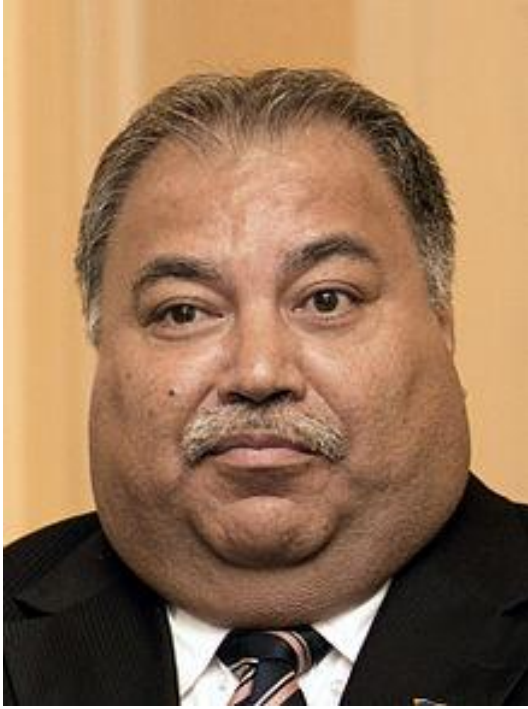
அதிபர் பாரன் வாக்வா

மக்கள் செல்வச்செழிப்பில் வாழ்ந்ததன் விளைவாகவோ என்னவோ நவ்ருக்கள் மிகவும் உடல் பருமன் மிகுந்தவர்கள் ஆயினர். உலகிலேயே உடல் நிறைகுறியீட்டு எண் ( BMI- Body mass index) அதிகமாக உள்ள மக்கள் நவ்ருக்களே. உலக சராசரி 18.5 - 24.9 என்ற அளவில் இருக்க இங்கு சராசரி 34- 35 என்ற அளவில் உள்ளது.