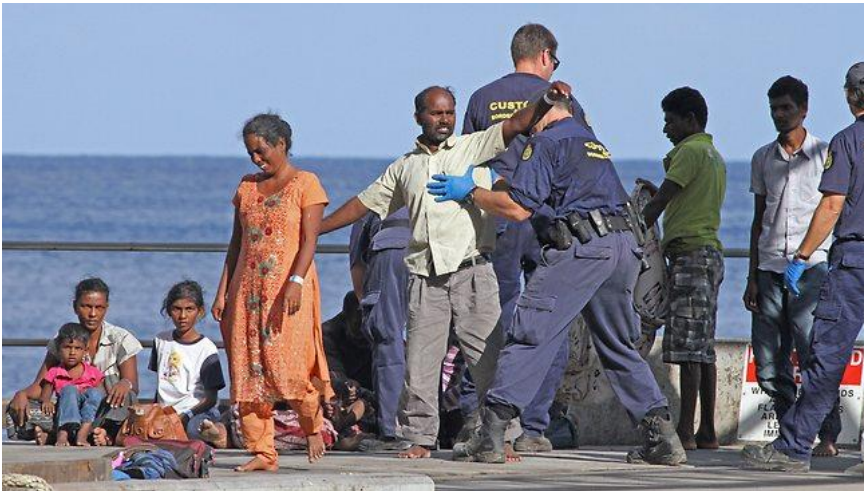
சோதிக்கப்படும் தமிழ் அகதிகள்

எனினும் இங்கு வரும் அகதிகள் பல கொடுமைகளுக்கு உள்ளாவதாய் குற்றச்சாட்டுகள் எழுந்துள்ளன. கடந்த இரண்டரை ஆண்டுகளாக நவ்ருவில் தடுத்து வைக்கப்பட்டிருந்த 30 வயது இலங்கைத் தமிழரின் புகலிடக் கோரிக்கை நிராகரிக்கப்பட்டதையடுத்து அவர் மரம் ஒன்றில் ஏறி தம் உயிரை மாய்த்துக் கொள்வதாகப் போராட்டம் நடத்தி அச்சுறுத்தினார். அவருக்கும் அவர் குடும்பத்தினருக்கும் உதவி கிடைக்க ஏற்பாடு செய்வதாக அதிகாரிகள் உறுதியளித்தனர். ஆனால் கீழே இறங்கி வந்தவுடன் அவரைக் காவல் துறையினர் கைது செய்து சிறையில் அடைத்தனர்.