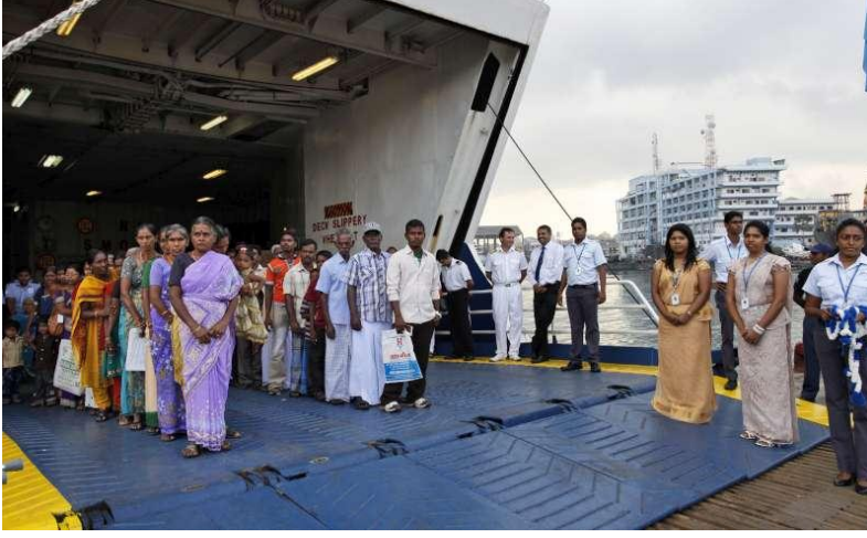
கப்பலில் வந்திறங்கும் தமிழ் அகதிகள்

ஆஸ்திரேலியாவிற்கு வரவிருந்த, நூற்றுக்கும் மேற்பட்ட இலங்கைத்தமிழ் அகதிகளைத் தடுப்பு முகாம்களில் நவ்ரு தங்கவைத்துள்ளது.