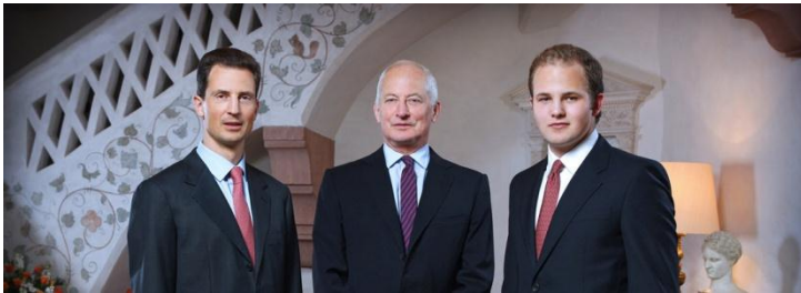
மன்னருடன் அரசு வாரிகுகள்- மகன் அலோய், பேரன் வென்சல்

லிச்டென்ஸ்டெயின் அரசியலமைப்புச் சட்ட முடியாட்சியாகும். 4 ஆண்டுகளுக்கு ஒருமுறை தேர்தலும், 25 பேர் கொண்ட நாடாளுமன்றமும் இருக்க மன்னரும் உள்ளார். மற்ற சில ஐரோப்பிய நாடுகளைப்போல மன்னர் 'ரப்பர் ஸ்டாம்ப்' வகையைச் சேர்ந்தவரில்லை.