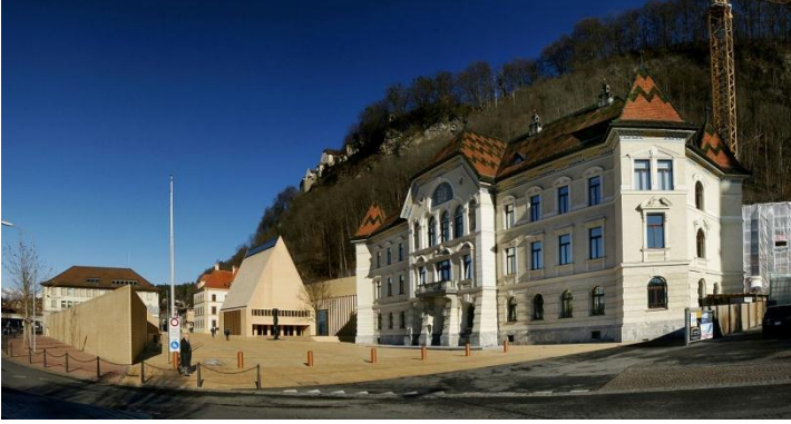
நாடாளுமன்றம், அரசு மையங்கள்

காவல்துறையே நாட்டின் பாதுகாப்பைக் கவனித்துக்கொள்கிறது. நாட்டில் குற்றச்செயல்கள் மிக மிகக் குறைவு. மக்கள் வீட்டுக்கதவுகளைப் பூட்டும் வழக்கமே இல்லை. 1997 க்குப் பிறகு எந்தக் கொலைச்செயலும் நடைபெறவில்லை. இந்நாட்டுச்சிறையில் ஒரு குற்றவாளி இரண்டாண்டே இருக்கமுடியும். அதற்குமேல் தேவைப்பட்டால் ஆஸ்திரிய நாட்டுச்சிறைக்குத்தான் அனுப்புவார்கள். தேவையற்ற இரைச்சல்களை வெறுக்கும் இந்நாட்டினருக்காக மதியம் 12-1.30 வரையும் மற்றும் இரவு 10 மணிக்கு பின்பும் புல்தரைவெட்டும் கருவி இயக்கல் உட்பட எந்த ஒலி மாசும் இங்கு தடைசெய்யப்பட்டதாகப் புதிதாக குடியேறுபவர்களுக்கு அரசு அறிவித்துள்ளது. மக்கள் 100% கற்றவர்கள். உலகின் சிறந்த கல்விமுறையில் இந்நாடு 10வது இடம் வகிக்கிறது. குட்டிநாடாயினும் 4 சிறந்த உயர்கல்வி நிறுவனங்கள் அறிவுப்பசியாற்றுகின்றன. 250 கி.மீ நீள சாலைகளும், 9.5 கி.மீ இருப்புப்பாதையும் நாட்டின் போக்குவரத்தை எளிதாக்கியுள்ளன. சைக்கிளில் செல்வோருக்காக 90 கி.மீ சைக்கிள் பாதையும் அமைத்திருக்கிறார்கள். ஆனால் பன்னாட்டு விமான நிலையம் ஏதுமில்லை. தேவையில்லை என்பதே காரணம்.