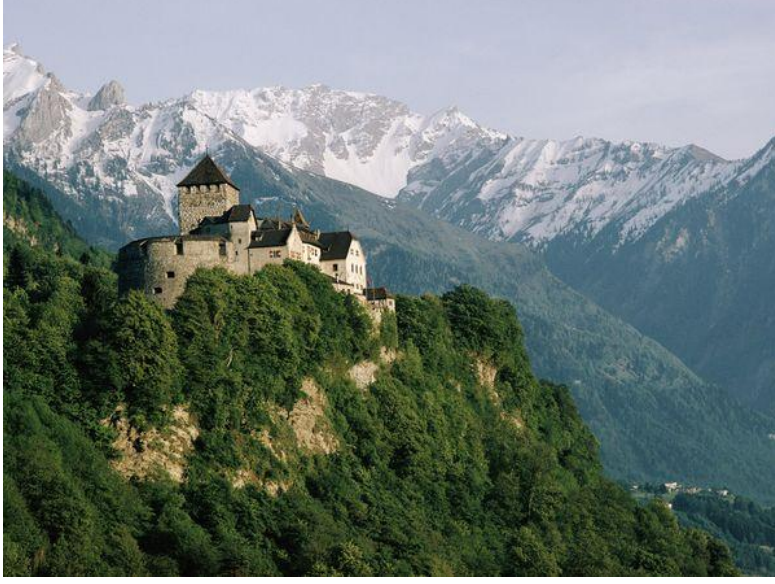
தனித்தன்மை கொண்ட இயற்கைப் பேரெழில்

வெறும் 37,000 மக்கள் வாழும் இந்த நாட்டின் பரப்பளவு 160.4 சதுர கி.மீ தான். நாட்டின் நீளமே 24 கி.மீதான். உலகின் வெது சிறிய நாடு. எனினும் கடுகு சிறுத்தாலும் குறையாத காரமாக, தனிநபர் வருவாயில், $1,57,040 என்று, உலகின் இரண்டாவது இடத்தில் உள்ளது.( இந்தியா 150 வது இடத்தில்- $1586). தெற்கிலும், மேற்கிலும் சுவிட்சர்லாந்து, வடக்கிலும், கிழக்கிலும் ஆஸ்திரியா என்று நாற்புறமும் லிசுடென்ஸுடெயின் நிலத்தால் சூழப்பட்டுள்ளது. இதுபோல நிலத்தால் முற்றிலும் சூழப்பட்ட இன்னொரு நாடு உஸ்பெஸ்கிஸ்தான். சுவிஸ் பெருநகர் ஜூரிச்சிலிருந்து லிசுடென்ஸுடெயின் தலைநகர் வடுசுக்கு 77 கி.மீ தொலைவுதான்.