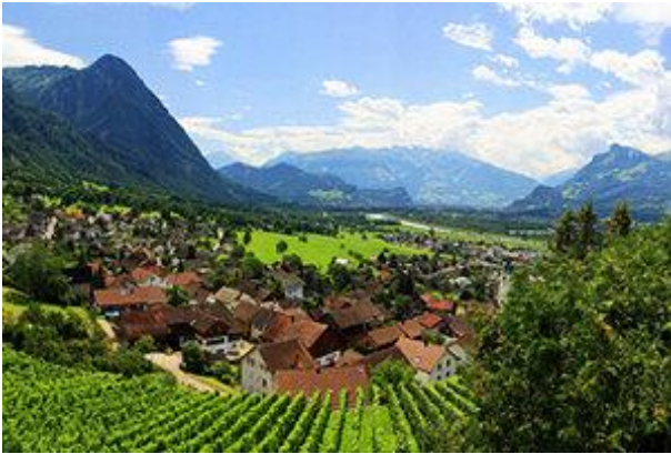
வடுஸ் நகரின் அழகு

மன்னர் இரண்டாம் ஹான்ஸ் ஆடம் மக்கள் அனைவருக்கும் தம் வடுஸ் கோட்டை தோட்டத்தில் பீர் விருந்து அளித்து மகிழ்விப்பார்.