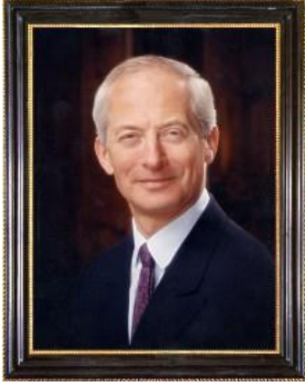
மன்னர் இரண்டாம் ஹான்ஸ் ஆடம்

ஜெர்மானியரிடமிருந்து இந்நாடு 1866 இல் விடுதலைபெற்ற தேசிய நாளான ஆகஸ்டு 15 அன்று( இந்திய சுதந்திர தினமும் இதுவே)