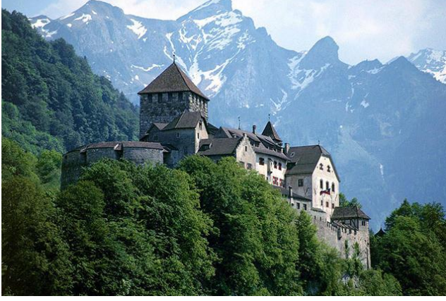
மன்னரின் வடுஸ் கோட்டை

ஜெர்மானியரிடமிருந்து இந்நாடு 1866 இல் விடுதலைபெற்ற தேசிய நாளான ஆகஸ்டு 15 அன்று( இந்திய சுதந்திர தினமும் இதுவே)