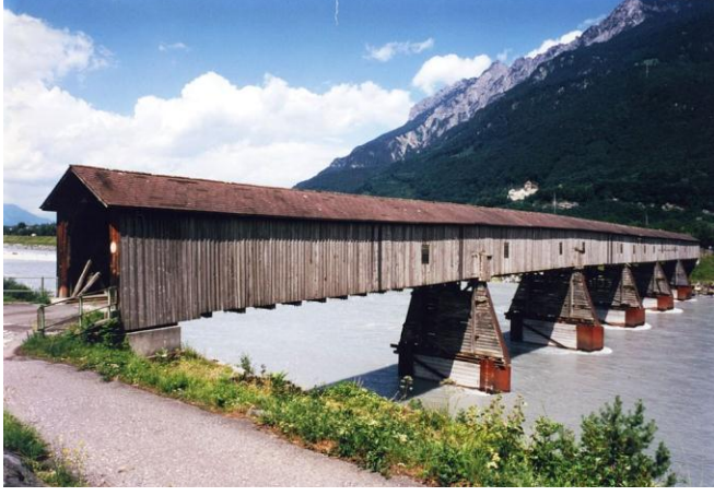
சுவிட்சர்லாந்திற்குச் செல்லும் நடைபாலம்

இங்கு ஜெர்மன் மொழியே ஆட்சி மொழி. எனினும் அல்மானிக் என்ற ஒருவகை ஜெர்மானிய கிளைமொழியே நாடெங்கும் பேசப்படுகிறது. ஜெர்மனியின் எல்லையில் இல்லாமல் ஜெர்மன் பேசும் ஒரே நாடு இதுவே. . மக்கள் பெரும்பாலும் அல்மானிக் ஜெர்மானியர். சிறிதளவு துருக்கியரும், இத்தாலியரும் உள்ளனர். 76% மக்கள் ரோமன் கத்தோலிக்கர். 9% பேர்கள் புராட்டஸ்டென்டுகள். இசுலாமியரும், மதமற்றோரும் தலா 5.4% உள்ளனர். யூதர்களும் சிறிய அளவில் உள்ளனர்.