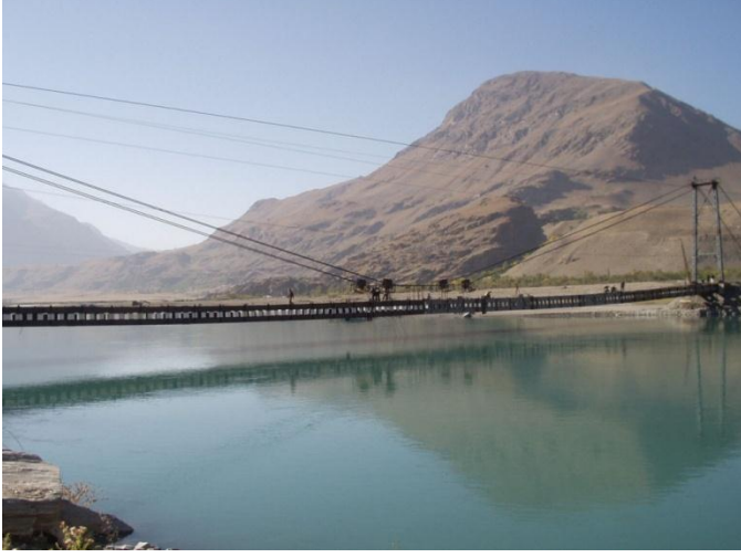
தாஜிக்- ஆப்கான் நட்புப்பாலம்

இது தாஜிக்- ஆப்கான் நட்புப்பாலம் என அழைக்கப்படுகிறது. இந்நாட்டிலுள்ள கோட்ஜன்டு நகர் பழைய பட்டுப்பாதையில் முக்கிய இடம் வகித்ததாகும்.