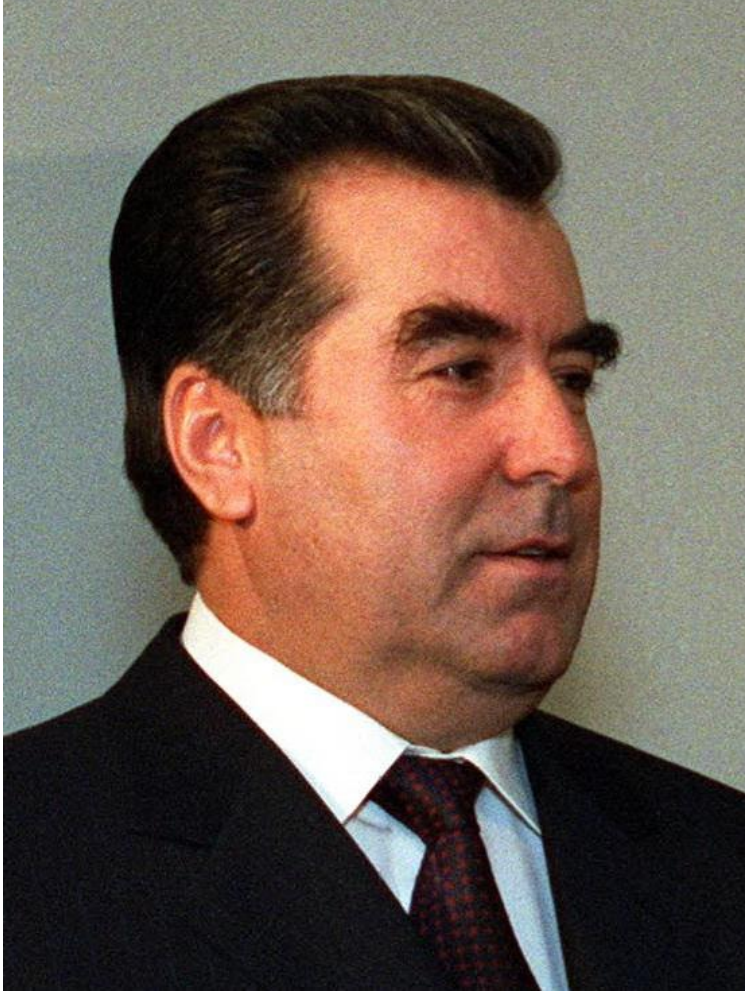
அதிபர் இமோம் அலி ரகுமான்

1992 இல் முந்தைய பிரதமர் அப்துமாலிக் அப்துல்லாஜனோவை தோற்கடித்து இந்நாட்டின் அதிபராக வந்தார் இமோம் அலி ரகுமான். இந்நாள் வரை இவரே தொடர்ந்து பல தேர்தல்களிலும் வென்று அதிபராக உள்ளார். இவர் ஆட்சியில் எதிர்கட்சியினர் சிறையிலடைக்கப்பட்டனரென்றும் சுதந்திரமான ஊடகங்கள் ஒடுக்கப்பட்டனவென்றும், ஊழல் பெருக்கெடுத்துள்ளதென்றும், மனித உரிமை மீறல்கள் நிகழ்ந்துள்ளனவென்றும் குற்றச்சாட்டுகள் உள்ளன. தம் மகனின் திருமணத்தில் இவர் மது அருந்திவிட்டுப் பாடிய காட்சி யு-டியூபில் வெளிவந்தது. இதன் விளைவாக யு-டியூபையே தம் நாட்டில் தடைசெய்தார். தொலைதொடர்பிலும், வணிகத்திலும் தொடர்பு மொழியாக விளங்கி வந்த ரஷ்ய மொழியின் முக்கியத்துவத்தைச் சட்டதிருத்தம் கொண்டு வந்து நீக்கினார். ஓவ், ஓவ்னா, எவ், ஓவிச் என்று ரஷ்ய மொழி மரபில் முடியும் பெயர்களில் இவ்வொலியை நீக்கி, தாஜிக் மொழி மரபைப்