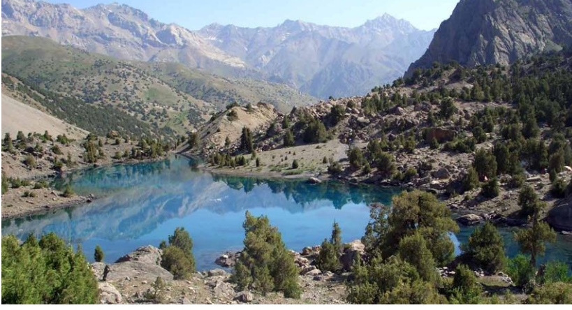
இதுபோல 900 நதிகள்

10. கி.மீ க்கு மேல் நீளமுள்ள 900 நதிகள் இந்தக் குட்டி நாட்டில் வலம் வருகின்றன. நாட்டின் பரப்பில் 2% ஏரிகள் அமைந்துள்ளன. 2255 மீட்டர் உயரத்தில் 2.5 கி.மீ நீளமும், 1 கி.மீ அகலமும் உடைய இஸ்கந்தர்குல் ஏரி மிக அழகானது.