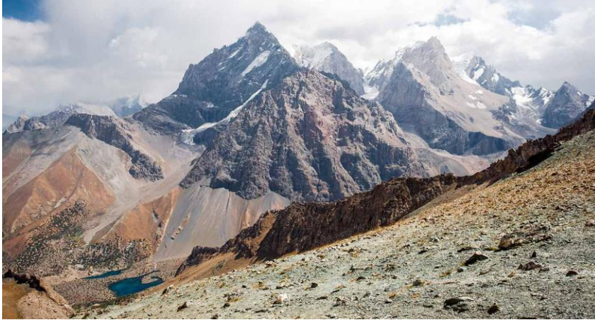
இதுபோல 7000 சிகரங்கள்

பாதி நாடு கடல்மட்டத்திலிருந்து 9800 ச.அடிக்கு மேல் உயர்ந்துள்ளது.