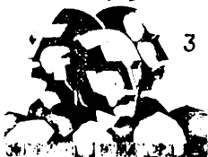
3 இன்று நாம் மாடுமும் சக்தி உலகத்தொழிலாளர்களை ஒன்றிணைப்புகள்