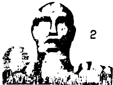
2 எடுத்தார் தொழிலாளர் உலகத்தொழிலாளர்களை ஒன்றிணைப்புகள்