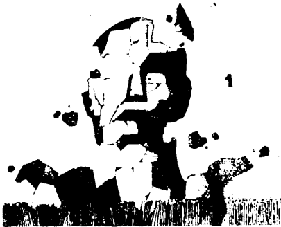
1 நூற்றாண்டுகளாக சுரண்டப்படும், அழித்தப்படும் கிடந்த உலகத்தொழிலாளர்களை ஒன்றிணைப்புகள்