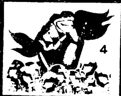
4 நானை வெற்றி நமக்கு! உலகத்தொழிலாளர்களை ஒன்றிணைப்புகள்

1984 ல் தொழிலாளர் ஒற்றுமை பற்றிய மிகச்சிறந்த கருத்துப் படமாக 'டைம்ஸ்' ஆப் இந்தியா ஒரு செய்தி வெளியிட்டது.